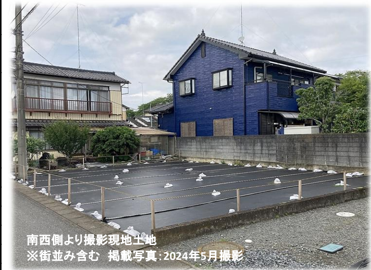
南西側より撮影現地土地 ※街並み含む 掲載写真:2024年5月撮影