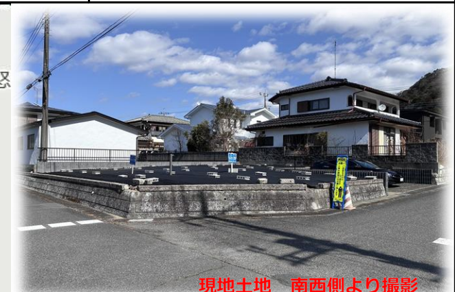
現地土地 南西側より撮影