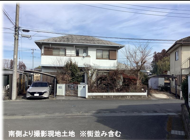
南側より撮影現地土地 ※街並み含む