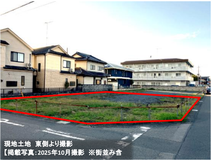
現地土地 東側より撮影 【掲載写真:2025年10月撮影 ※街並み含