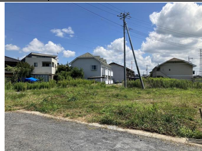
現地土地 南西側より撮影 ※街並み含む 掲載写真 2025年8月撮影