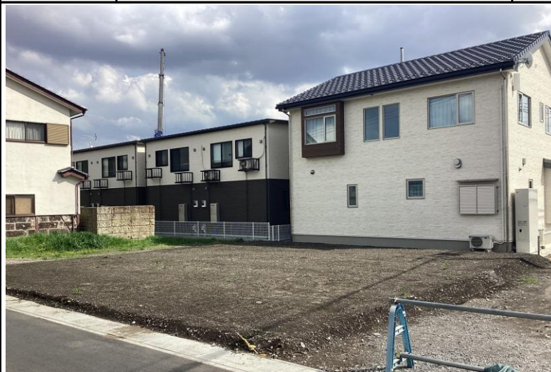
北西側より撮影現地土地【2026年4月撮影】※街並み含む