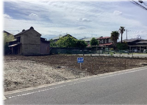
2026年5月 東側前面道路より現地土地撮影 ※街並み含む