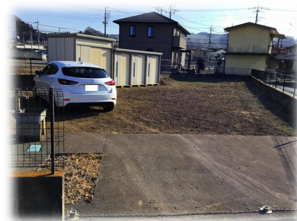
現地土地 西側より撮影 ※街並み含む