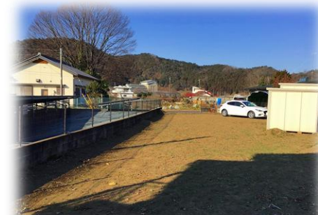
現地土地 東側より撮影 ※街並み含む