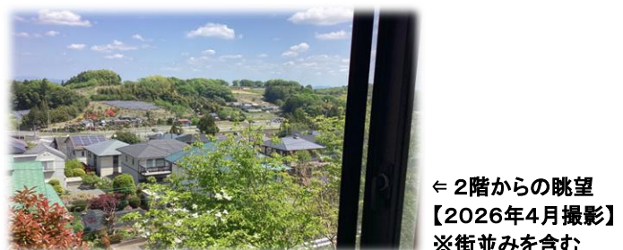
← 2階からの眺望 【2026年4月撮影】 ※街並みを含む