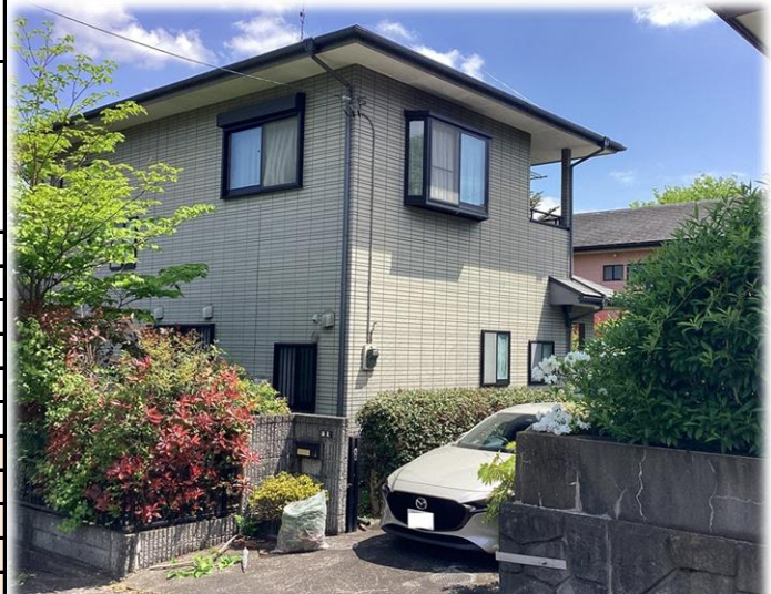
西側道路より撮影現地外観【2026年4月撮影】 ※街並みを含む