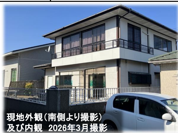
現地外観(南側より撮影)及び内観 2026年3月撮影