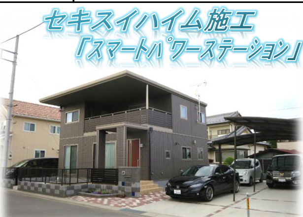
掲載写真撮影日:2020年5月