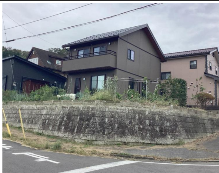
北西側より撮影現地外観【2025年10月撮影】※街並みを含む