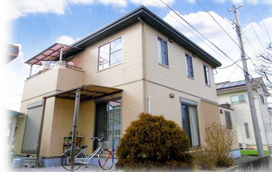
掲載写真2022年2月撮影 現地外観 ※街並み含む