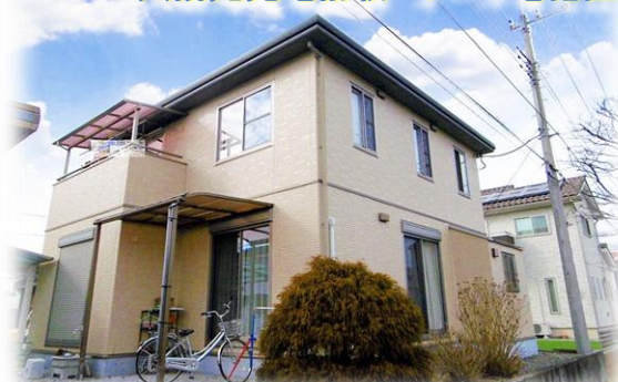
掲載写真2022年2月撮影 現地外観 ※街並み含む