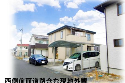
西側前面道路含む現地外観