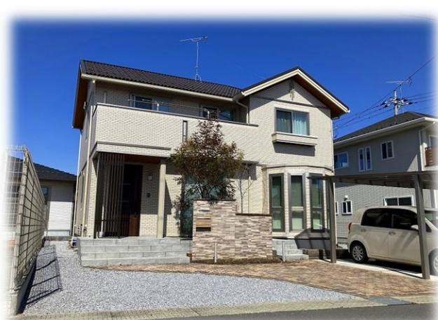
現地外観 南東側より撮影 掲載写真2025年3月 撮影