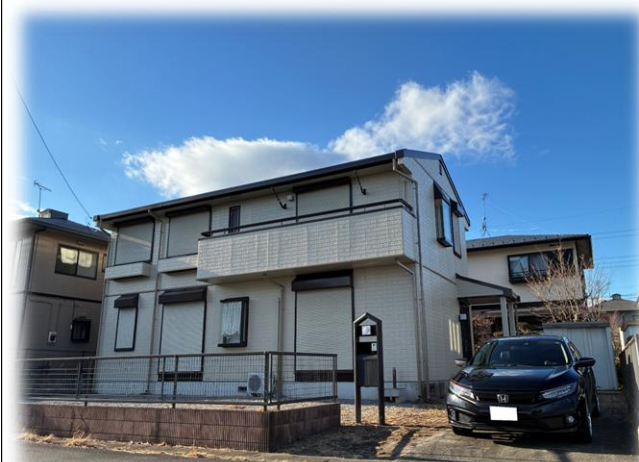
現地外観 南東側より撮影 掲載写真2025年12月 撮影