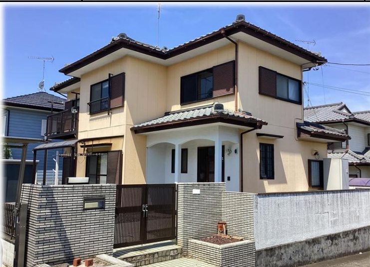
南東側より撮影現地土地【2026年5月撮影】※街並み含む