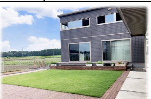
セキスイハイム施工「Bj」