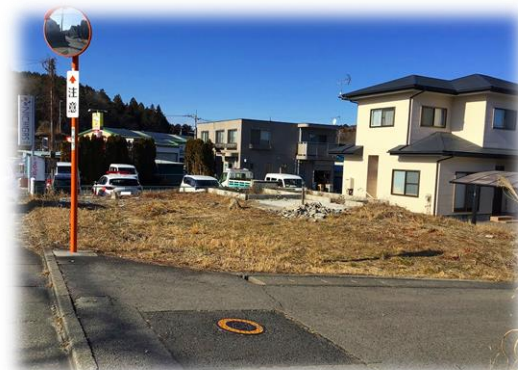
ロビンシティ A-1 2021年2月 撮影