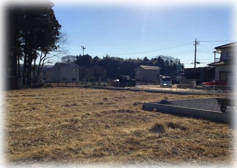
現地写真 2021年2月撮影