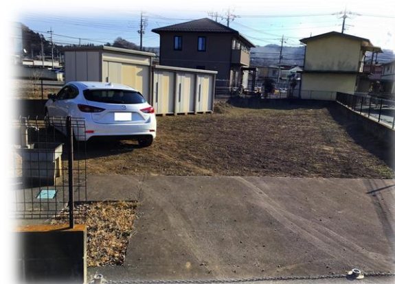
西側より撮影 2021年2月