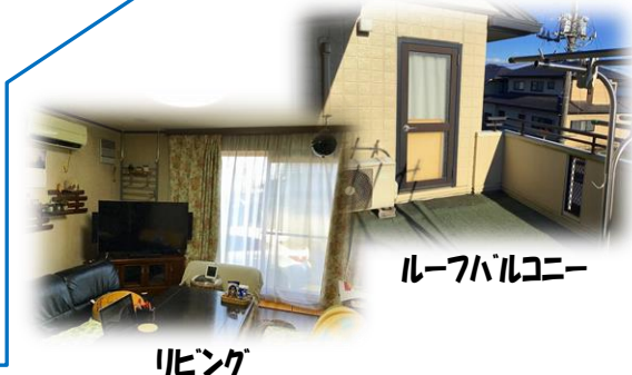
ルーフバルコニー