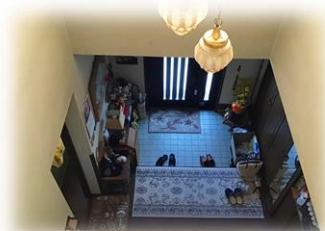
吹き抜けのあるホール