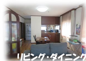
リビング・ダイニング